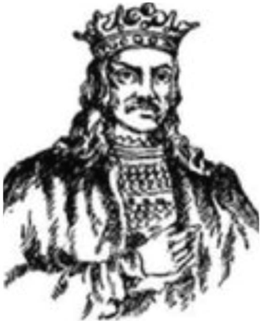
Юрій II Болеслав