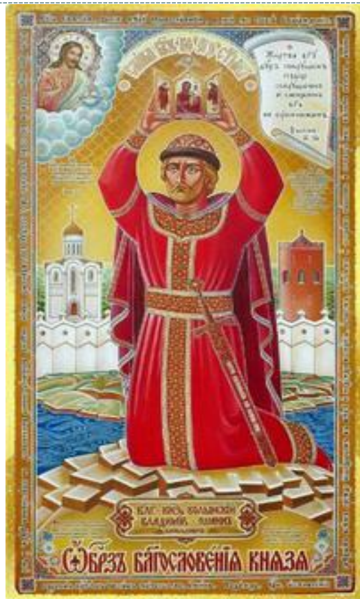
Володимир (1270—1289 рр.)

Однак незабаром помер Шварно, а згодом і Василько. Волинським князем став син Василька Володимир.